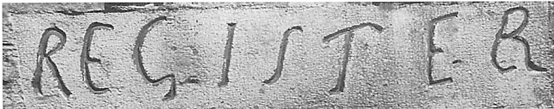
Inscription de Marie Durand, emprisonnée de 1730 à 1768 dans la Tour de Constance à Aigues-Mortes

http://www.rtl.fr/actu/a-new-york-on-continue-a-mourir-du-11-septembre-7765451172