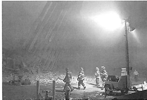
New York, 11 septembre 2001

http://www.rtl.fr/actu/a-new-york-on-continue-a-mourir-du-11-septembre-7765451172