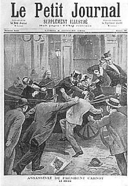
Assassinat du Président Sadi Carnot à Paris en 1894