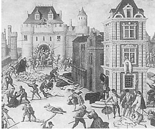
1572 Massacre de la Saint-Barthélemy