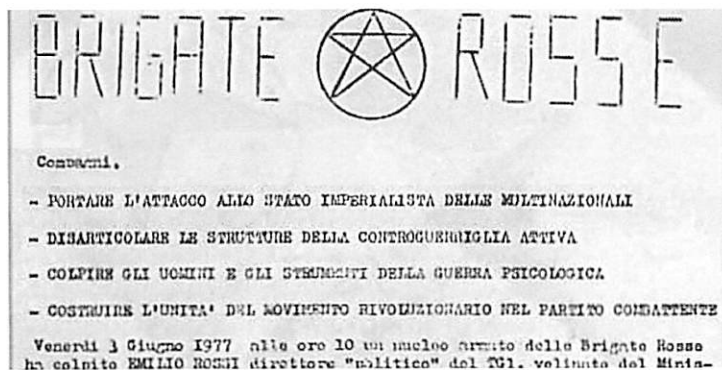
Volantino delle Brigate rosse, 1977