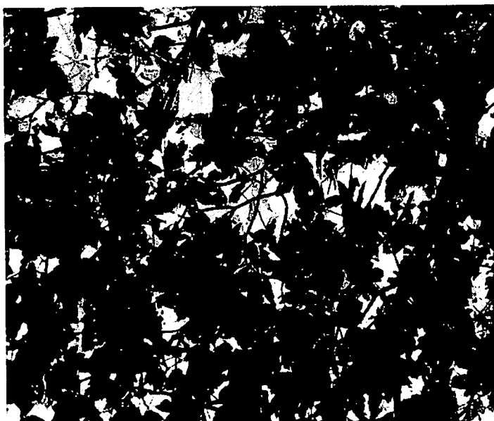
Giocare di luce e di ombra, di piero nerieri

A tutti i partecipanti verrà rilasciato a richiesta un attestato di partecipazione